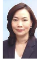
ศ.ดร.วีณา จีระแพทย์