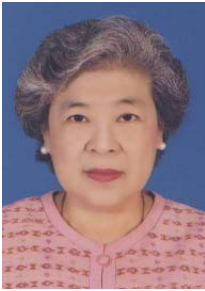
ผศ.อังคณา สรียากรณ์ เลขาธิการสภาการพยาบาล