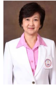
ดร.กฤษฎดา แสงดี อุปนายกสภาการพยาบาล คนที่สอง