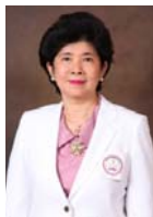
ศ.ดร.วิภาดา คุณาวิกติกุล