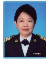
นาวาอากาศเอกหญิง ตลฤดี โรจน์วิริยะ