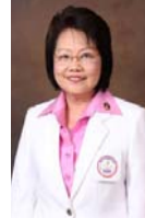
รศ.ดร.สุจิตรา เหลืองอมรเลิศ